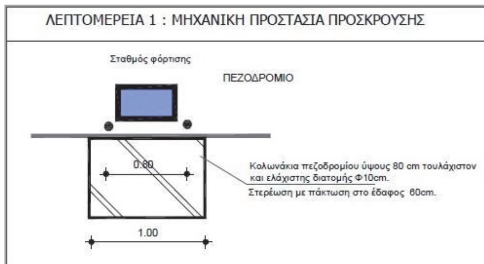
Εικόνα 1.γ: Λεπτομέρεια μηχανικής προστασίας.