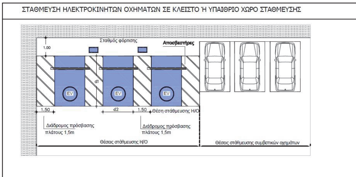
Εικόνα 1.β: Ενδεικτική χωροθέτηση θέσεων στάθμευσης και σταθμών επαναφόρτισης σε κλειστό ή υπαίθριο χώρο στάθμευσης.